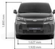
PROACE KASTENWAGEN L1